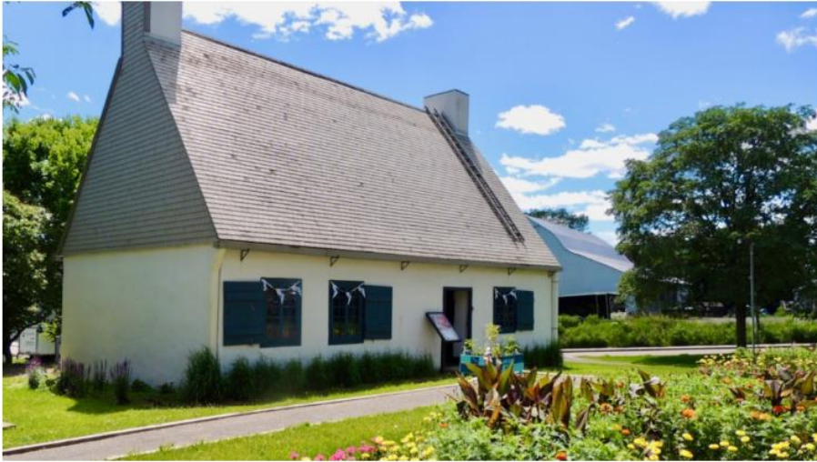
La Maison Girardin se trouve à l'intérieur du périmètre du Site patrimonial de Beauport.